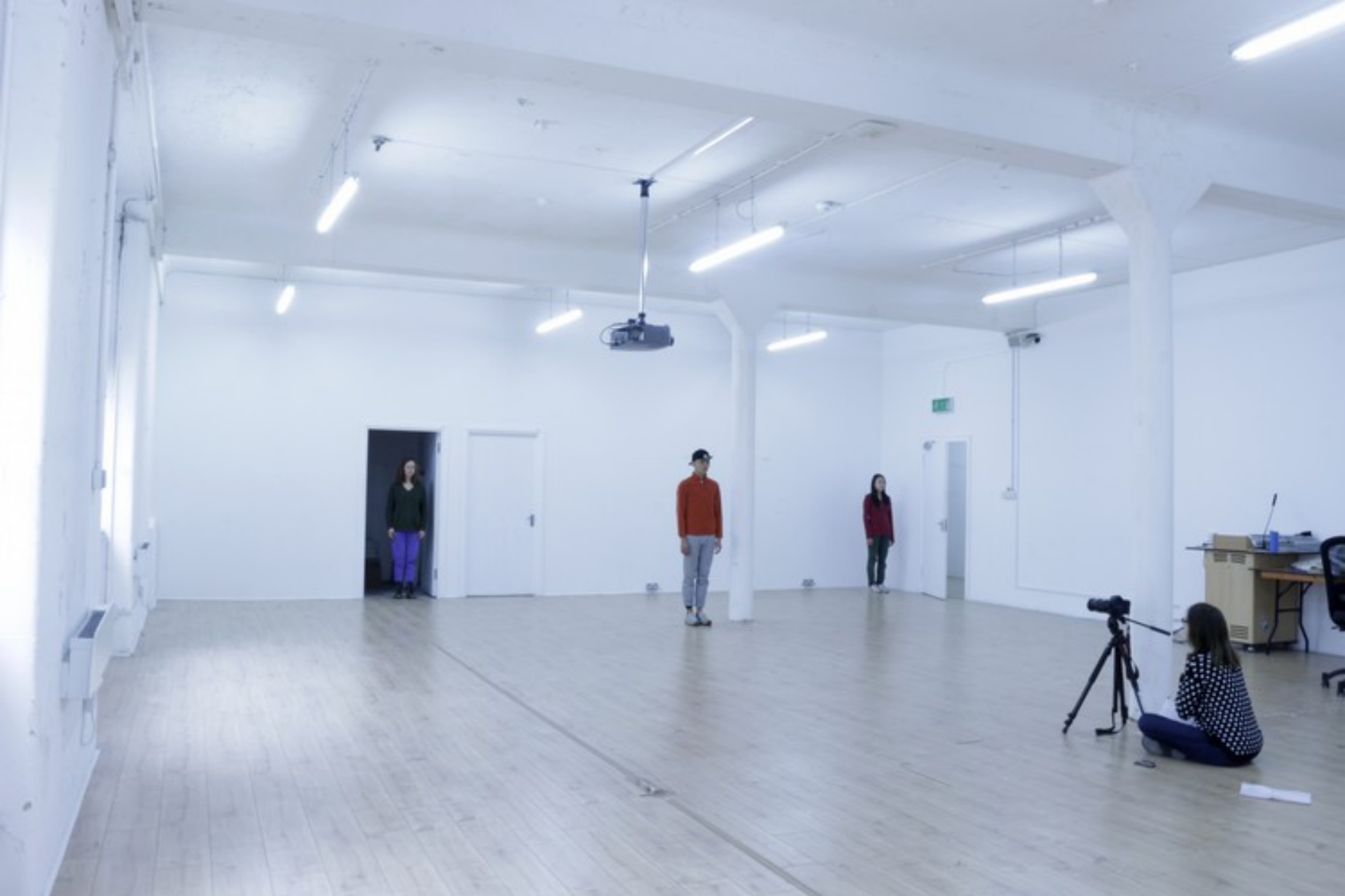
Inês Bento Coelho