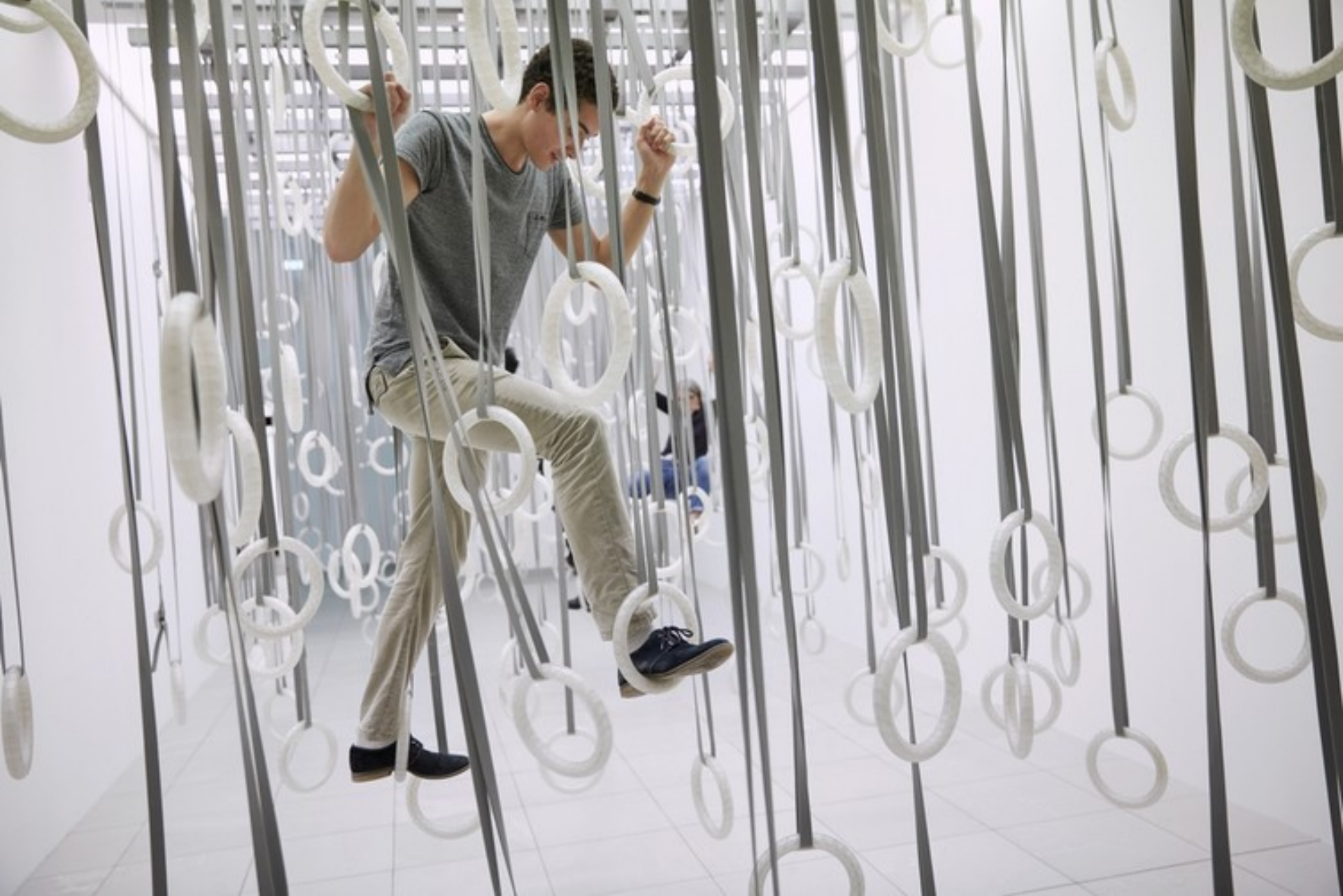
William Forsythe, The Fact of Matter , 2009