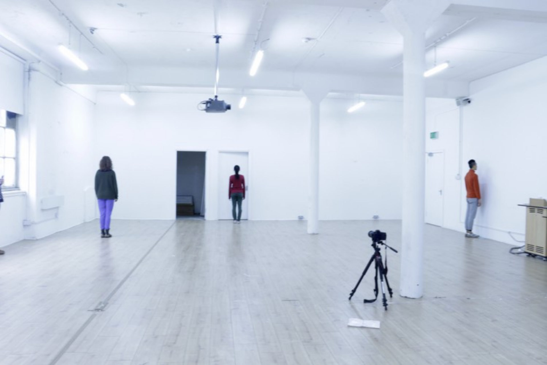
Inês Bento Coelho