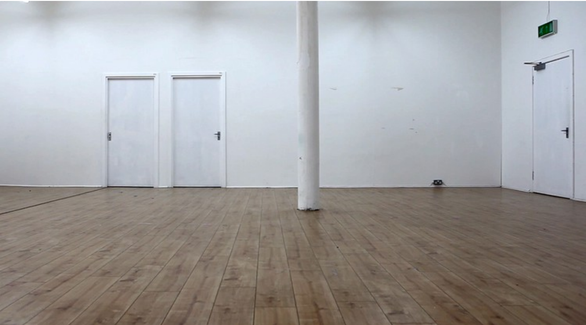
Inês Bento Coelho, Dancing Doors , 2016